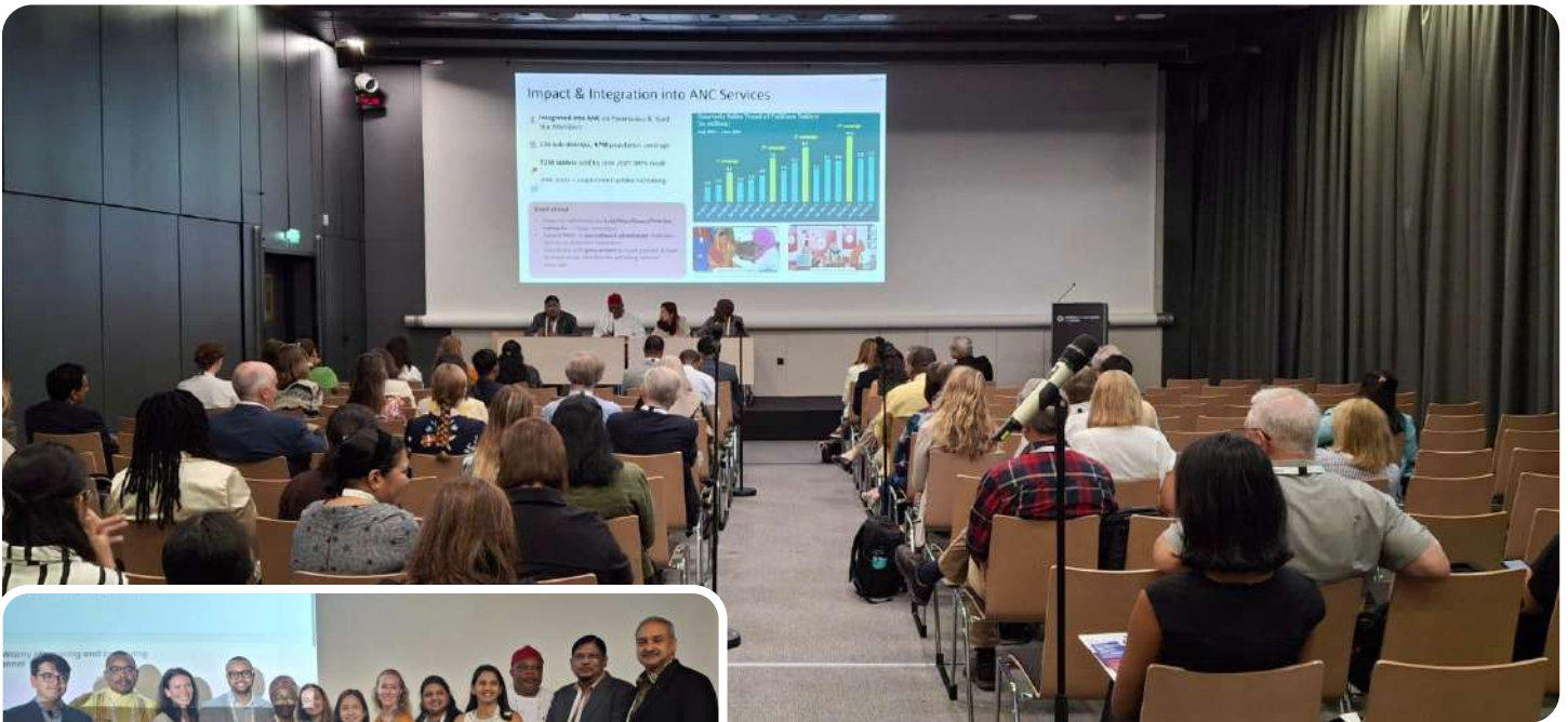
The delegation attended discussions on emerging topics such as sustainable food systems, climate change, artificial intelligence in nutrition research, non-communicable diseases, and life-cycle based public health approaches.

A major highlight of SMC’s participation was the panel discussion on “From Policy to Scale-Up: Learnings from Countries at Various Stages of the Transition” held on 28 August 2025. During this session, the MD & CEO presented SMC’s market-based Multiple Micronutrient Supplements (MMS) model, demonstrating how affordability, accessibility, and integration with community antenatal care have enabled large-scale nutrition impact in Bangladesh. The presentation received strong appreciation from around 70 distinguished participants for showcasing a sustainable private-sector approach to delivering MMS nationwide.